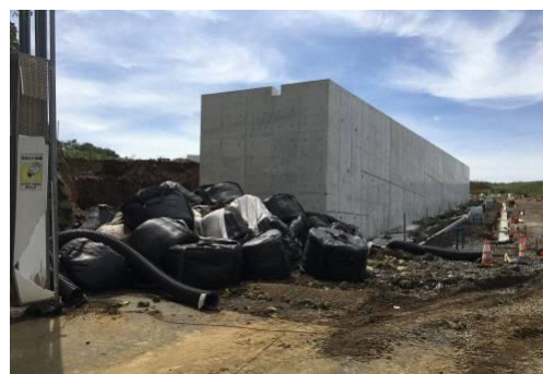
台風後現場状況写真